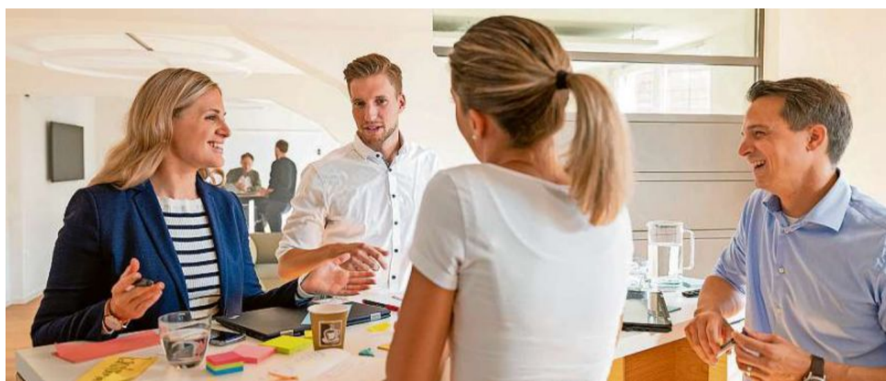
Um zukunftsfähig zu bleiben, müssen Firmen auch die Kompetenzen und Profile der bestehenden Belegschaft weiterentwickeln.

Die Geschäftsmodelle der digitalen Anbieter orientieren sich nicht mehr an der Pflege einer auf bestehenden Produkten basierenden Marke, sondern an der per-